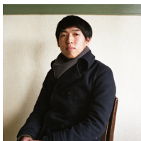
<<ひとりできない>> ©横山大介

「自己」と「他者」をテーマに取り組んだ若手写真家たち(菱田雄介、横山 大介、ほか)の視点を探ります。