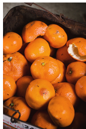
<<一枚皮だからな、我々は。>>

塩竈フォトフェスティバル2016写真賞大賞の受賞作。同世代の女性たち、生まれ育った和歌山の自然、愛犬や家族との日常を、みずみずしい感性で掬い上げた。